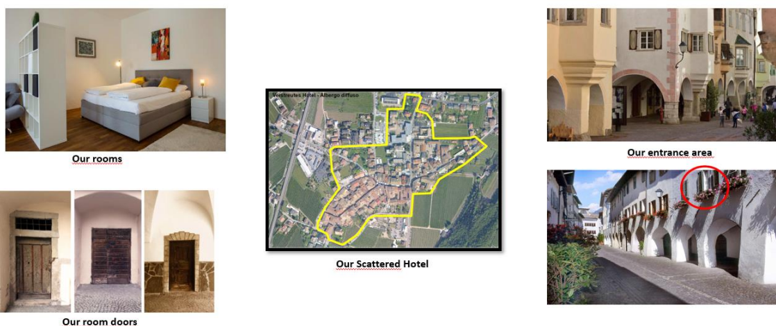
Fig. 2 Emotion Living – Albergo Diffuso, Egna, Alto Adige