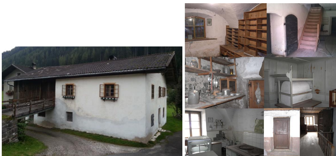
Fig. 3 Maso Knablhof, prima della ristrutturazione – Provincia di Bolzano