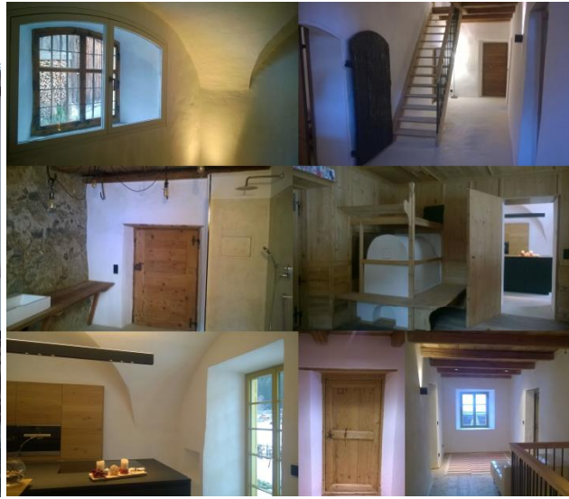
Fig. 4 Maso Knablhof, dopo la ristrutturazione - Provincia di Bolzano